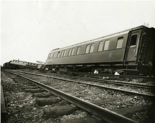
Foto: het treinongeval in Houten 1917